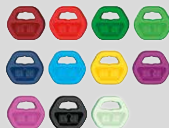
Färbige Schlüsselclips (Miniclips ebenfalls erhältlich)